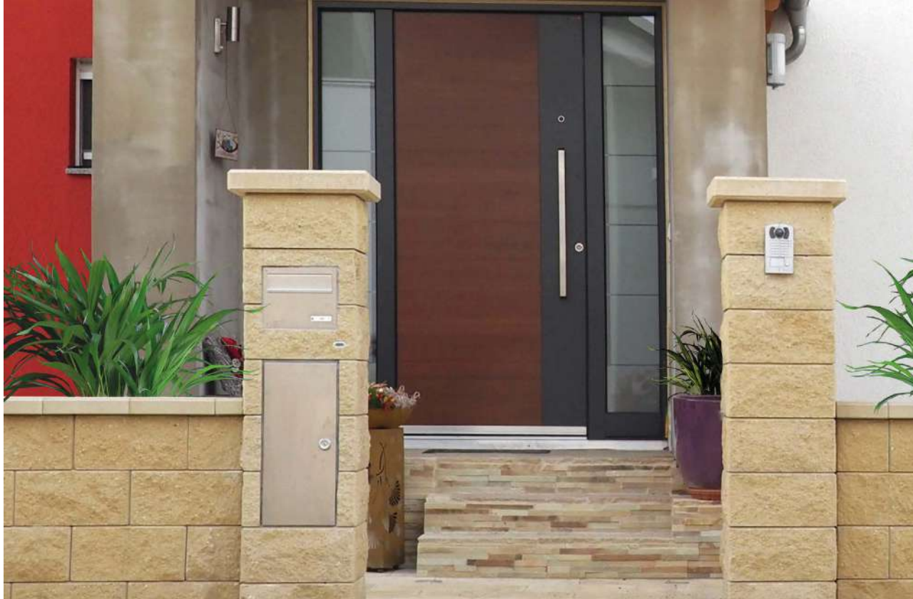
Briefkasten- und Paketboxstein, Designblock Pfeilerstein Kongur | Farbe: Elfenbein, Oberfläche: Gespalten Frontplatte Briefkasten und Paketbox aus Edelstahl