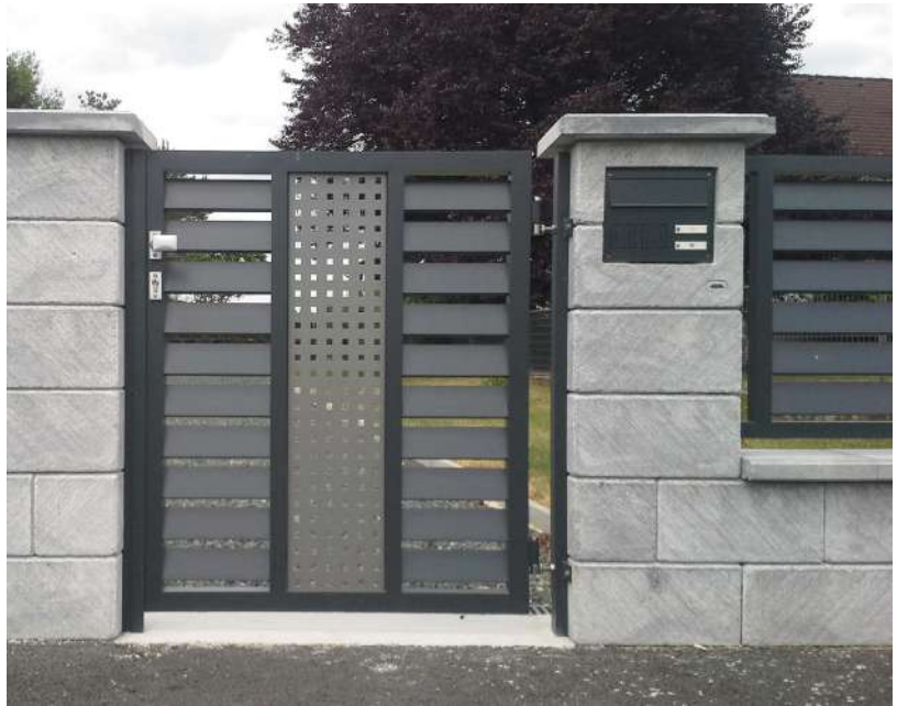
Briefkastenstein | Farbe: Wesardo, Oberfläche: Eldino, Frontplatte Briefkasten in Anthrazit

Vollenden Sie Ihr Zaunprojekt! Mit Liebe zum Detail erstellen wir die maßgetreue Aussparung für den edlen Briefkasten in Ihren Mauerstein. Wählen Sie das passende Modell – gerne auch in Ihrer Wunschfarbe – aus unserem Sortiment.